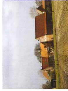
Ferme de la Pouillerie

7. Au troisième pont, quittez le canal, partez sur la droite et suivez le chemin pavé. Prenez à gauche vers la ferme de la Pouillerie (Propriété Privée - Gîte).