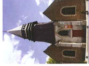
L'église St Martin

La chapelle Notre-Dame de la Route comprend deux superbes petits vitraux. Continuez dans la rue Pas-teur.